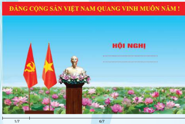
Hình 2 (Cờ có cán)