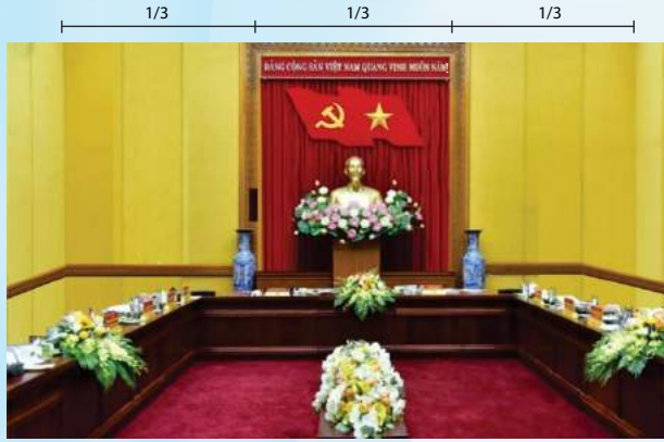
Hình 4b (kích thước hội trường nhỏ)