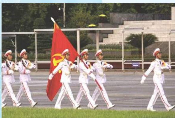
Hình 23c (vác cờ)