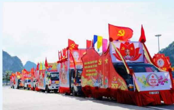
Hình 24d (rước bằng xe)