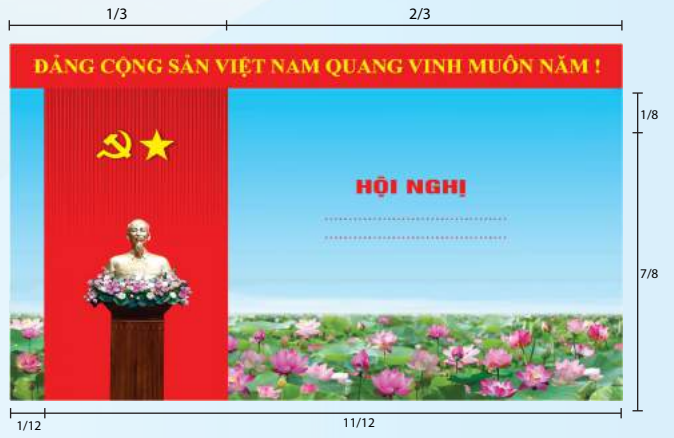
Hình 5a (cờ xếp dọc)