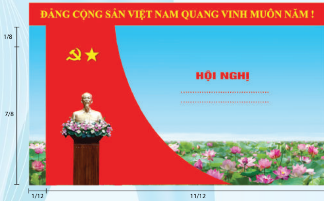
Hình 5b (cờ xếp chéo đơn)