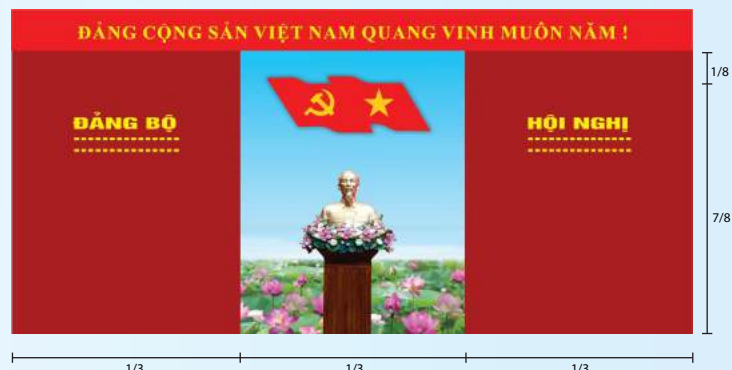
Hình 4a (kích thước hội trường rộng)