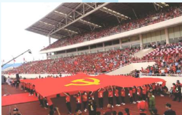
Hình 24a (rước cờ vai)