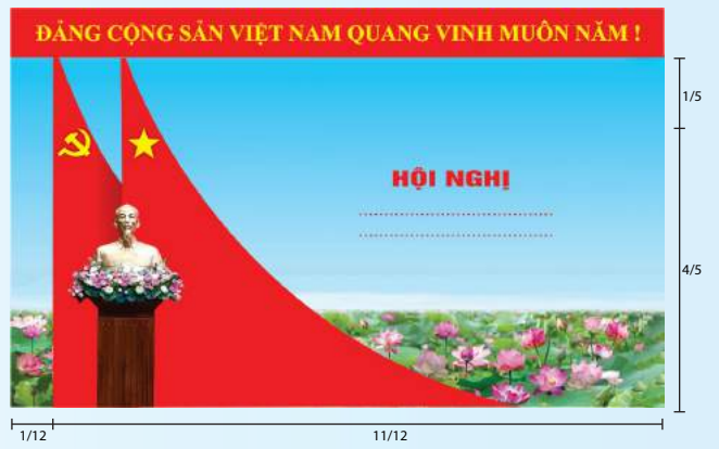
Hình 5c (cờ xếp chéo đôi)