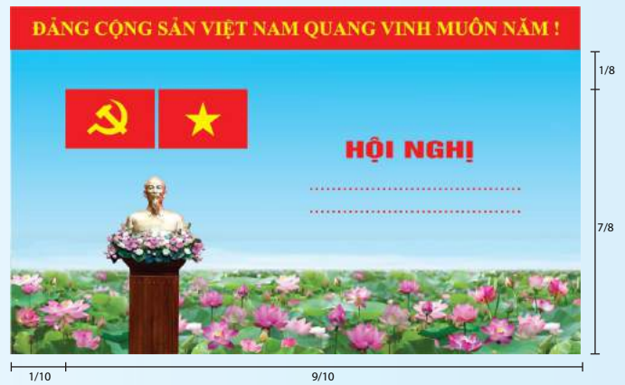
Hình 3a (cờ không tạo sóng)