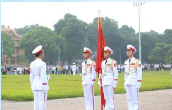
Hình 23a (cầm cờ)