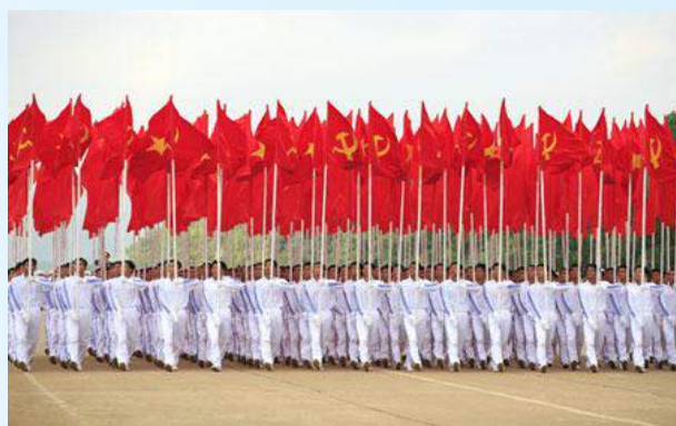
Hình 24b (rước theo hàng)