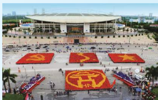
Hình 32 (xếp bằng người)