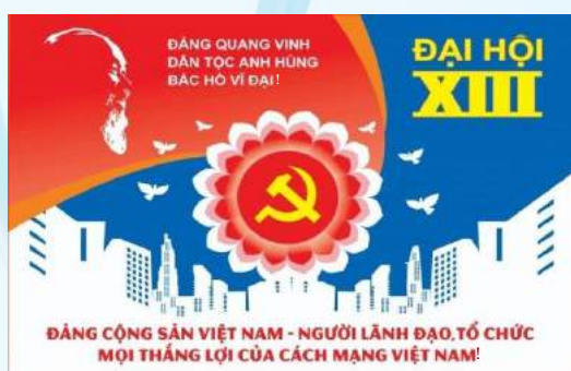
Hình 31b (panô tuyên truyền)