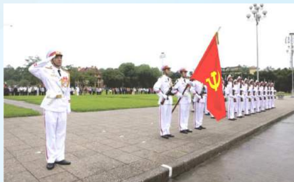
Hình 23b (giương cờ)