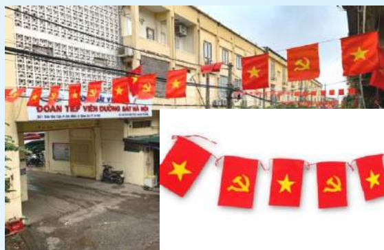
Hình 16b (cờ dây)