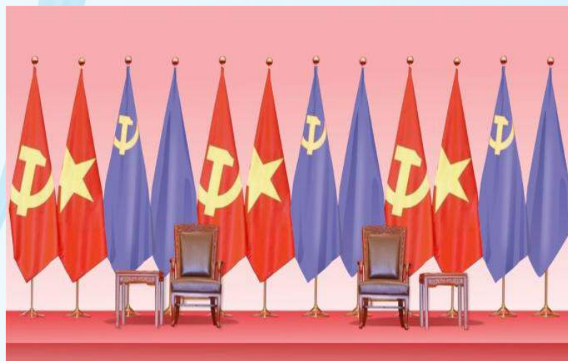
Hình 22 - (2 cờ màu tím là minh họa cờ Đảng và Quốc kỳ nước khách)

Điều 12. Nơi tổ chức các hoạt động đối ngoại đảng, ngoại giao nhà nước