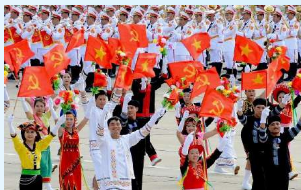
Hình 23d (vẫy bằng tay)